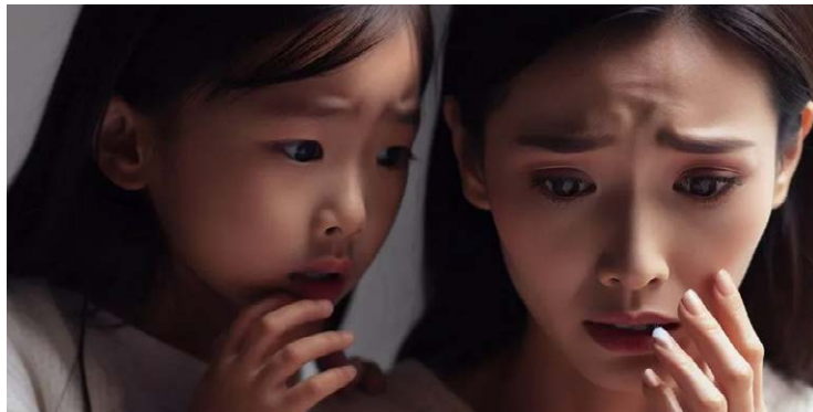
Casos de deep nude crescem nas redes sociais em todo o país

Uma nova epidemia virtual, o deep nude, afeta crianças, adolescentes e mulheres, expondo a urgência de medidas jurídicas e legislativas em relação a inteligência artificial