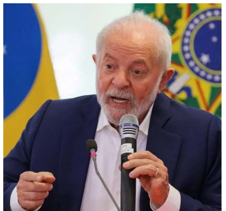
Lula da Silva: otimista sobre crescimento da economia em 2024

Para além de mobilizar a proposição de uma série de medidas a fim de aumentar a arrecadação, como a taxação de fundos exclusivos e de apostas esportivas, a situação tem gerado um impasse sobre o compromisso de cumprir a meta fiscal de zerar o déficit público no próximo ano.