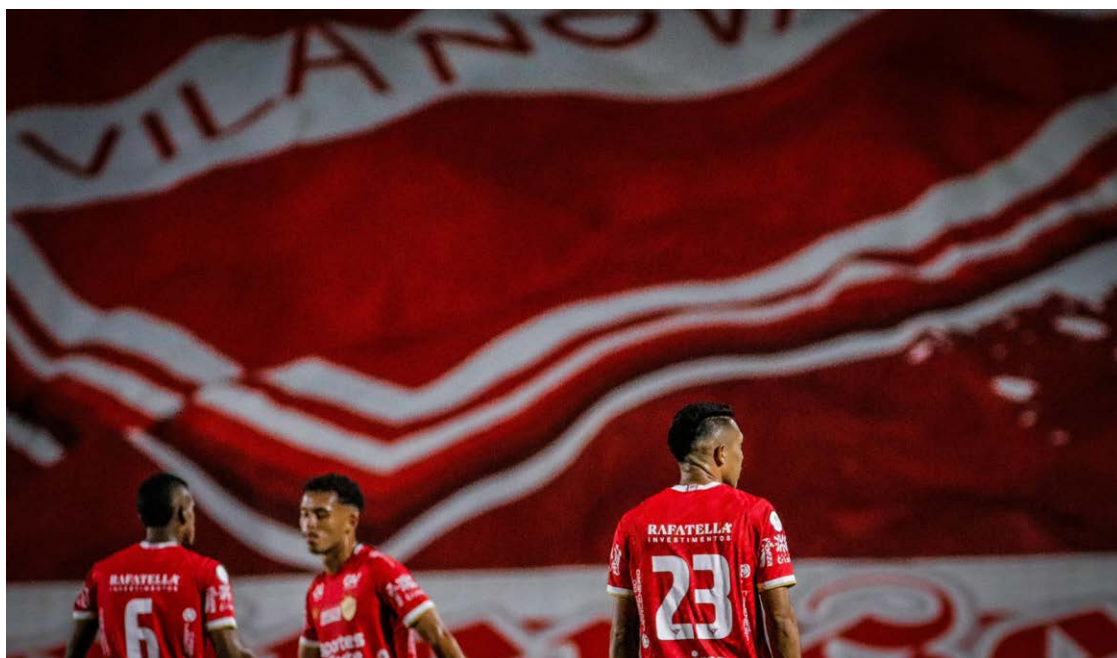
Vila Nova jogou muito bem na noite de sexta: time estava encantado

Por sua vez, a derrota despachou o Londrina para a série C, pois antes da partida ocupava o penúltimo lugar. Apesar do gol de honra, o rebaixamento era certo para o Tubarão. Se afundou ontem no OBA.