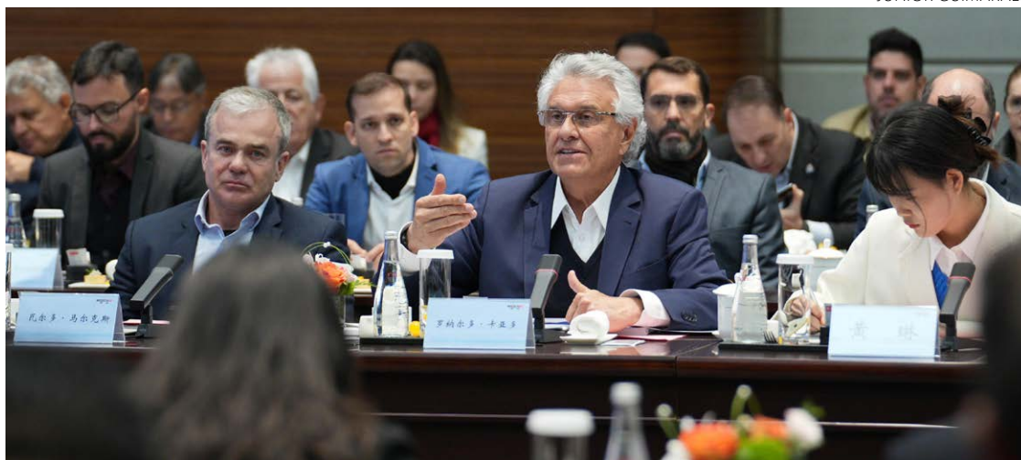
Ronaldo Caiado tenta trazer a Weichai Power, fabricante de motores, para Goiás: nova reunião ocorre no sábado

O governador Ronaldo Caiado diz que busca tecnologia, empregos e parcerias econômicas que desenvolvam Goiás.