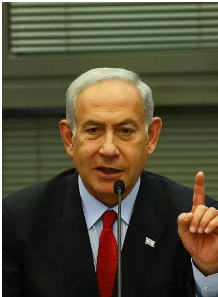
Benjamin Netanyahu, primeiro-ministro de Israel polêmico e desgastado no país e no mundo

Como uma democracia moderna vive sob tamanha ameaça? É esta exatamente a dúvida que essas forças diabólicas querem inculcar nas mentes de todos os israelenses. Elas não estão buscando concessões mútuas com o Estado judaico. Seu objetivo é demolir a certeza dos israelenses de que seus serviços de defesa e inteligência são capazes de protegê-los de ataques surpresa transfronteiriços — e então os israelen-