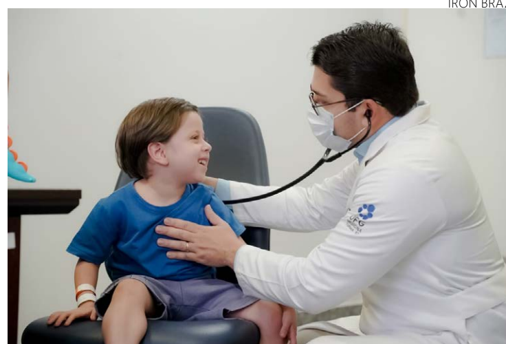
Pediatras afirmam que crianças são mais sensíveis às alterações de temperatura

Dados do Centro de Informações Meteorológicas e Hidrológicas de Goiás (Cihmego)