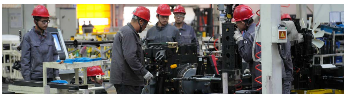
Números da Weichai são impressionantes: empresa fatura por ano US$ 52 bilhões e possui 100 mil funcionários