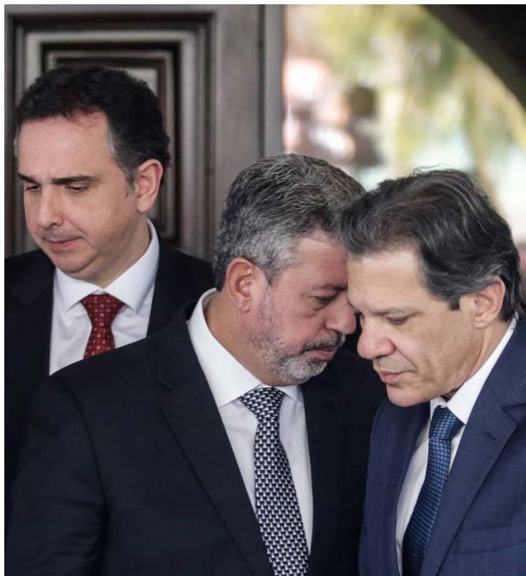
Rodrigo Pacheco, Arthur Lira e Fernando Haddad: disputa por emendas aos parlamentares

Haddad já chegou a criticar publicamente o volume de recursos destinados ao atendimento de emendas de parlamentares. Em agosto, durante entrevista a Reinaldo Azevedo, afirmou que o país vive um parlamentarismo sem primeiro-ministro e questionou o comprometimento de 0,4% do PIB (Produto Interno Bruto) com emendas. “Onde no mundo tem isso?”, indagou à época.