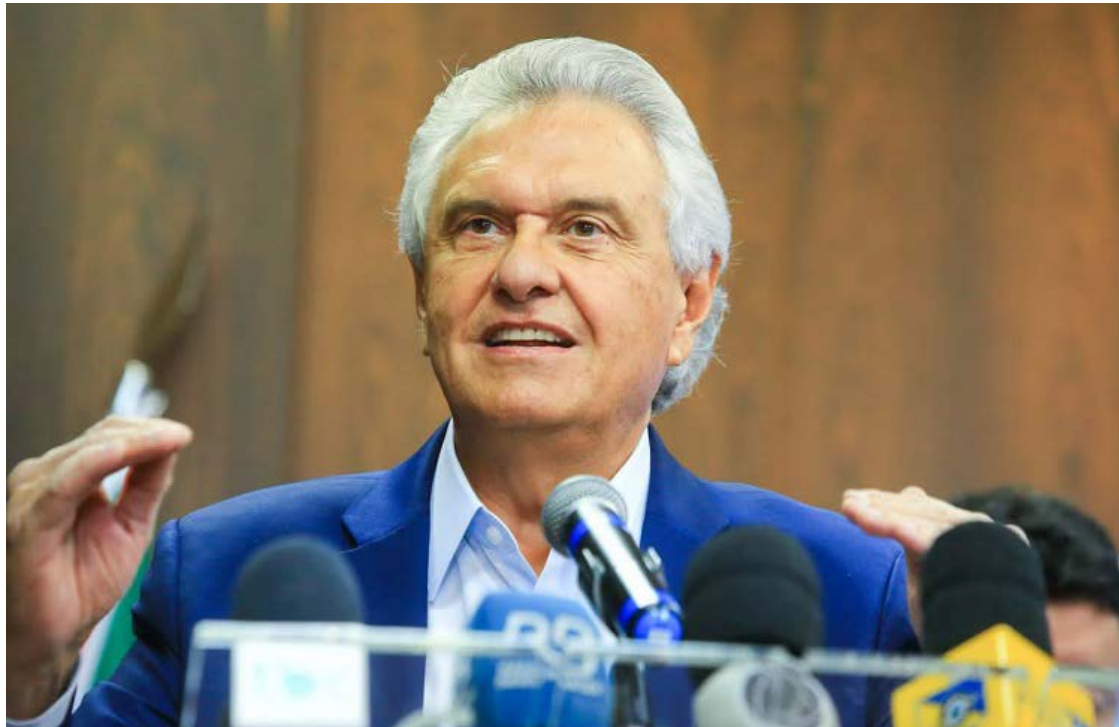
Ronaldo Caiado: Senado diminui as receitas de estados e municípios

A perda de autonomia para gerir a própria arrecadação e a impossibilidade de conceder incentivos para atrair empresas são pontos citados pelo governador goiano como os mais evidentes do prejuízo que terão os estados fora do eixo sul-sudeste. “Goiás perde em todas as pontas. A reforma corta o FCO (Fundo Constitucional de Financiamento do Centro-Oeste). Só aí perdemos R$ 3 bilhões. Perde a autorização de implantar políticas de incentivos fiscais. Penaliza os 102 municípios mais eficientes. Retira nossa prerrogativa de gerir nossa própria arrecadação. Goiás vai pagar muito caro pela