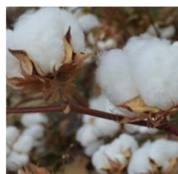
136,0 mil toneladas de algodão na Safra 2023/2024 devem ser entregues pelos agricultores goianos

à última safra, este é o segundo melhor resultado do agronegócio goiano na série histórica deste levantamento da Conab. Estamos sofrendo o efeito do El Niño, que tem impacto importante sobre a produtividade das culturas, e há também desafios de mercado relevantes. Mesmo assim, temos boas notícias, e seguimos trabalhando, ao lado do produtor, para abrir novos mercados e avançar cada vez mais”, afirma o secretário de Agricultura, Pecuária e Abastecimento, Pedro Leonardo Rezendes.