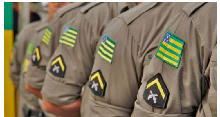
As armas de fogo usadas por policiais militares e bombeiros militares devem ser cadastradas no Sistema de Gerenciamento Militar de Armas (Sigma), bem como as armas particulares.