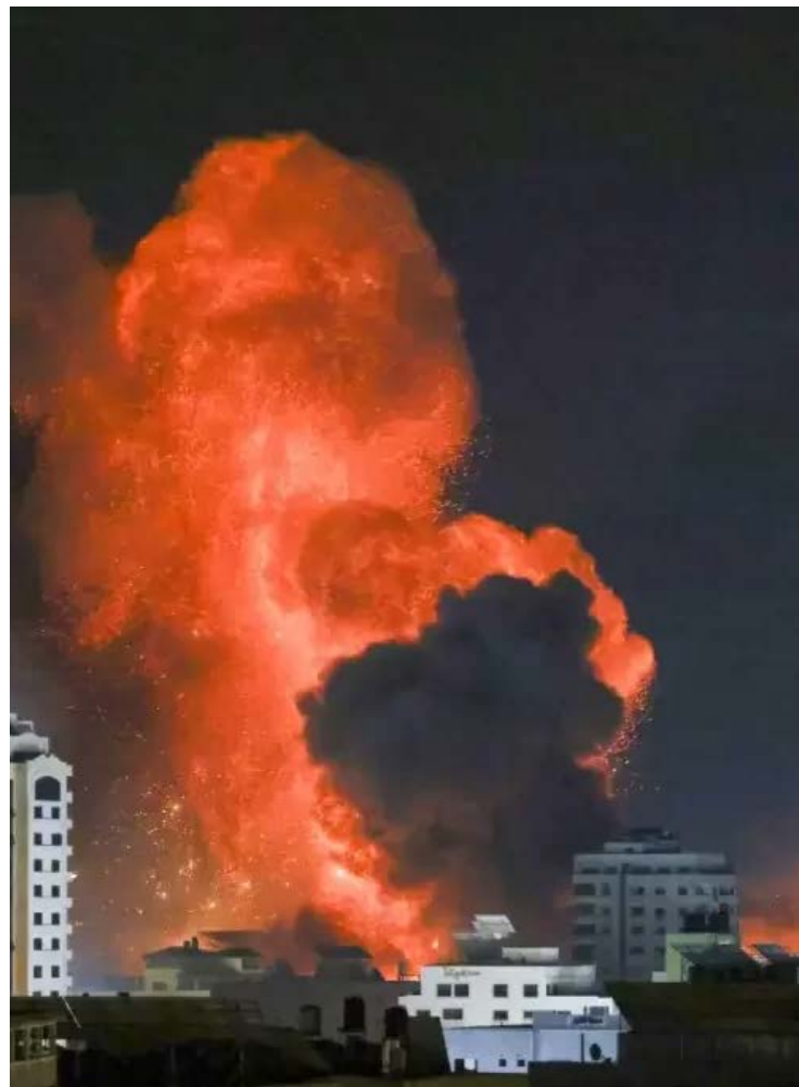
Guerra Israel-Hamas: sem diplomacia e com ódio, palestinos e judeus são exterminados

Pior ainda, eu fico estarrecido com a intensidade com que este líder, o primeiro-ministro Binyamin Netanyahu, continua a colocar o interesse de garantir o apoio de sua base de extrema direita — e culpou preventivamente os serviços de segurança e inteligência de Israel pela guerra — à frente de manter a solidariedade nacional ou fazer qualquer uma das coisas mais básicas que o presidente Biden precisa para conseguir os recursos, os aliados, o tempo e a legitimidade que Israel precisa